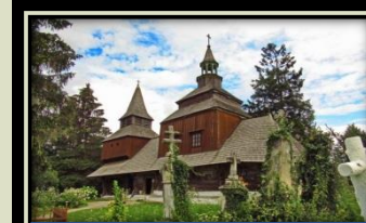
Церква Святого Духа, 1598 рік (м.Рогатин)