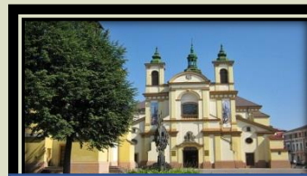
Колегіальний костел Пресвятої Діви Марії, 1672 рік (м.Івано-Франківськ)