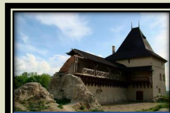
Галицький замок, 1367-1658 роки (м.Галич)

На Івано-Франківщині на початок 2024 року зони охорони встановлено навколо 14 комплексів та 1095 окремих пам'яток. Укладено 835 охоронних договорів