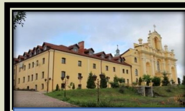
Костел Благовіщення і монастир кармелітів, 1624 рік (селище Більшівці)