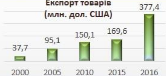
Експорт товарів (млн. дол. США)

Партнерами міста у зовнішній торгівлі товарами були нерезиденти з 87 країн світу