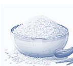
Рис ▼ -2,8%